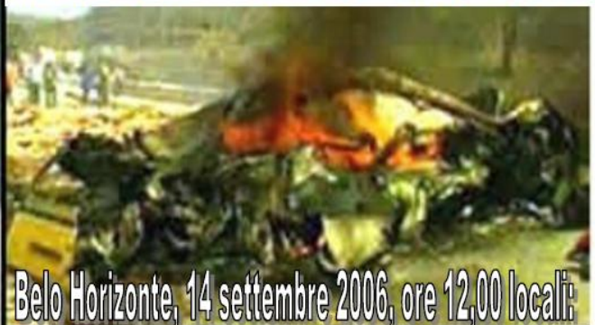
Belo Horizonte, 14 settembre 2006, ore 12,00 locali: incidente mortale sulla Statale 381